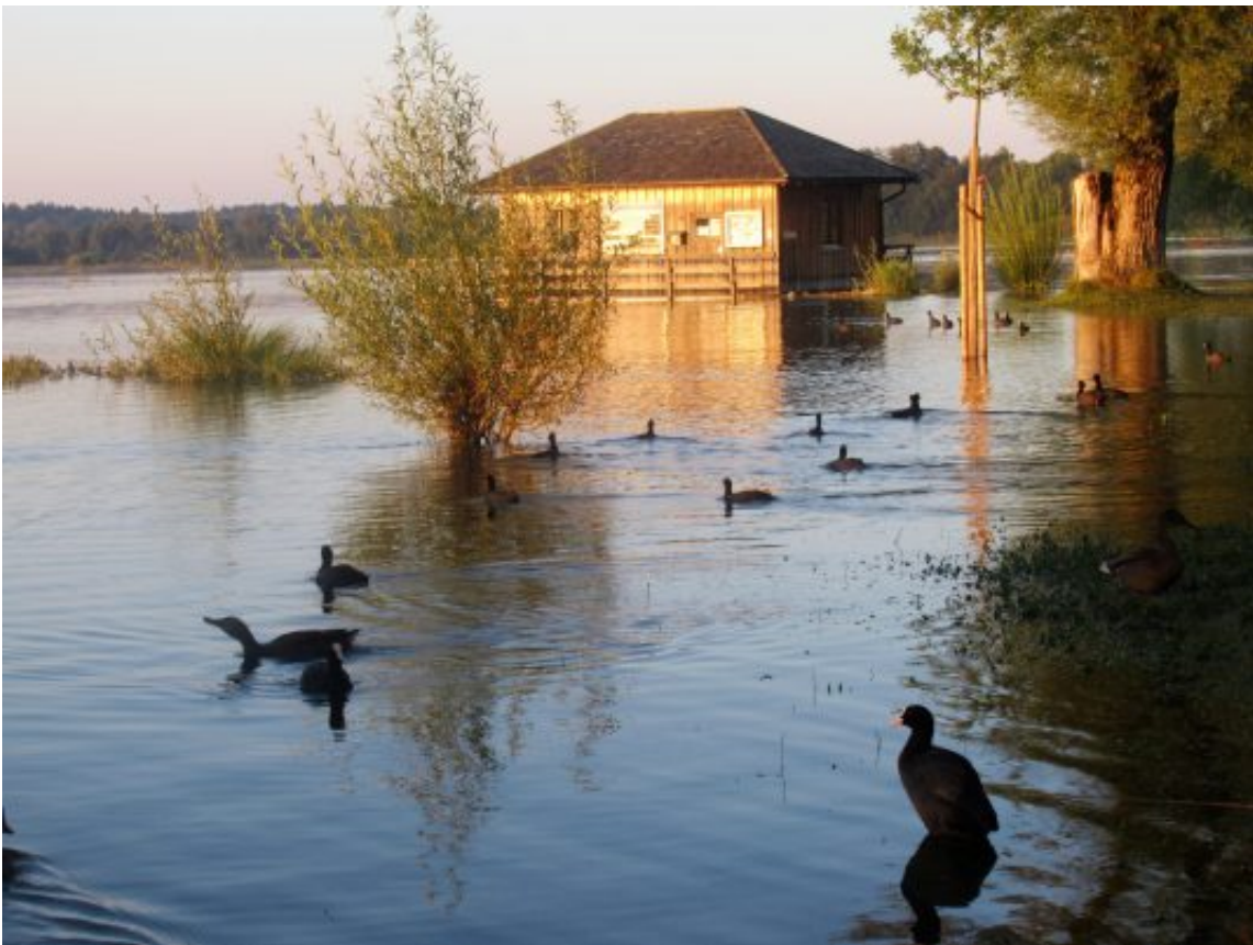
Wasservögel am überfluteten Ufer