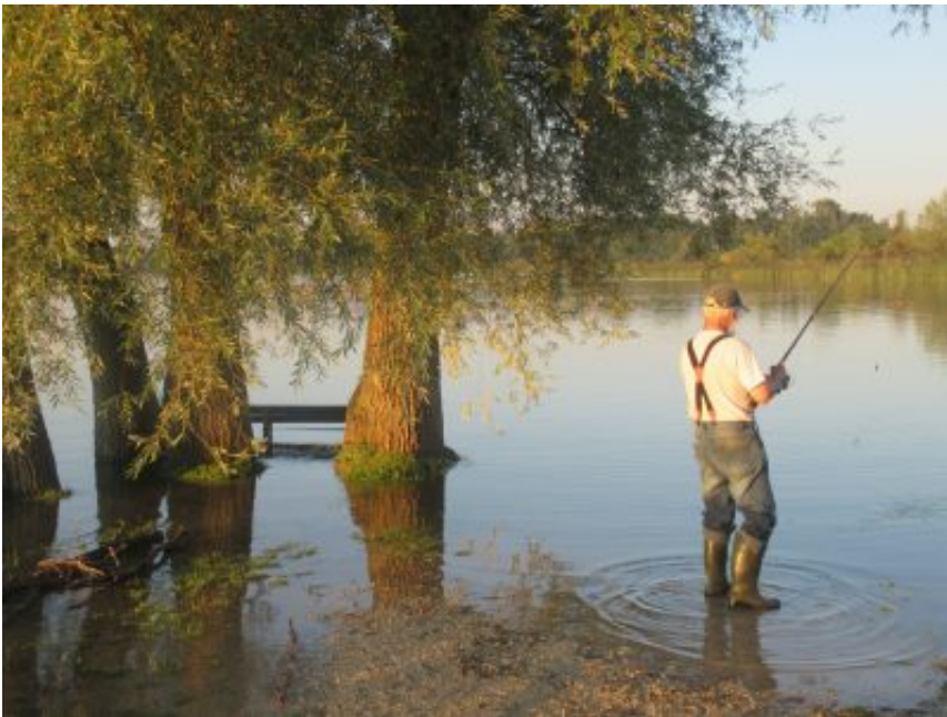
beißen nicht an heute