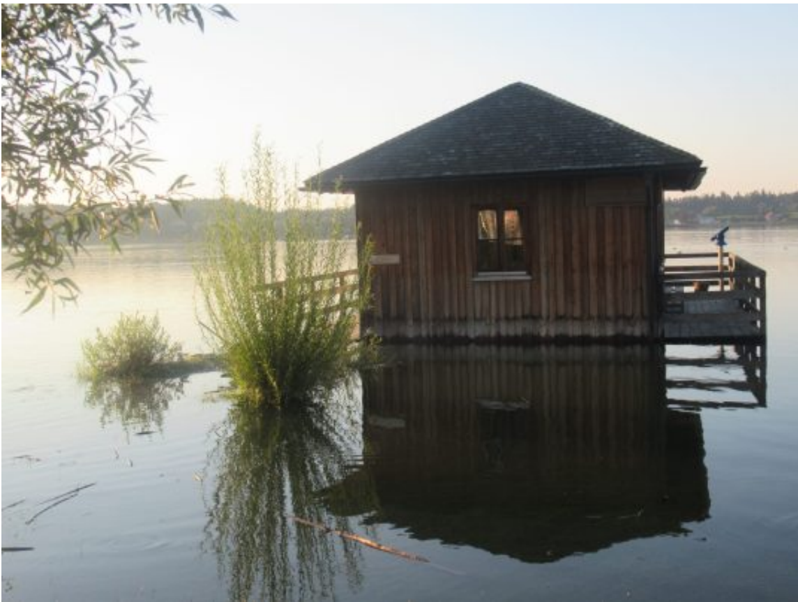
Vogelbeobachtungshütte unter Wasser