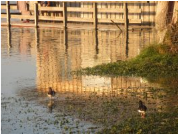
Wasservögel am überfluteten Ufer