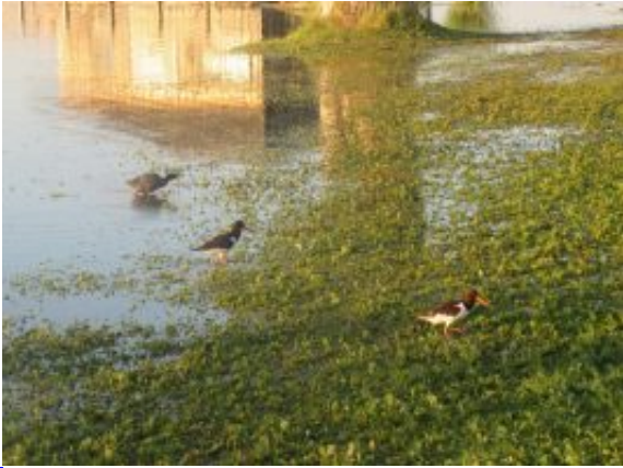
Wasservögel am überfluteten Ufer