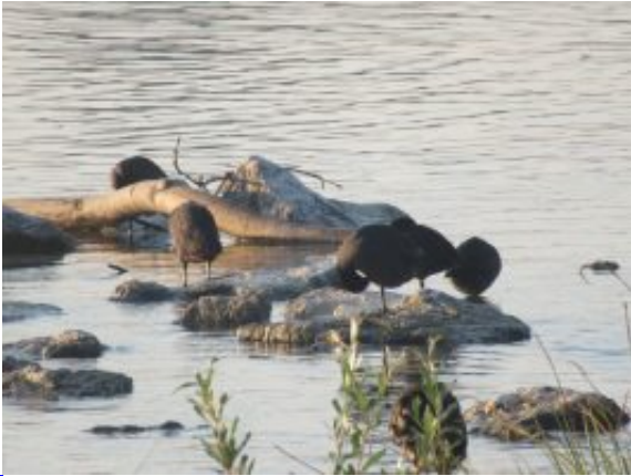
Wasservögel genießen letzte Sonnenstrahlen