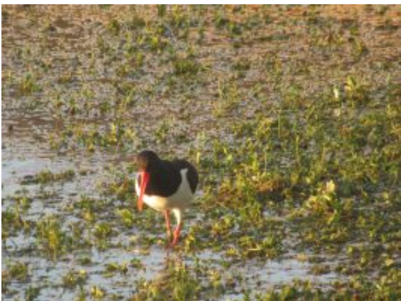
Wasservogel am überfluteten Ufer