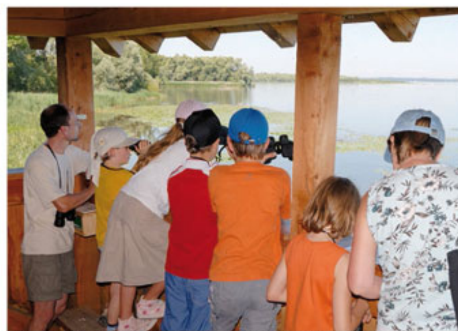
Vogelbeobachtung auf dem Naturbeobachtungsturm Hirschauer Bucht