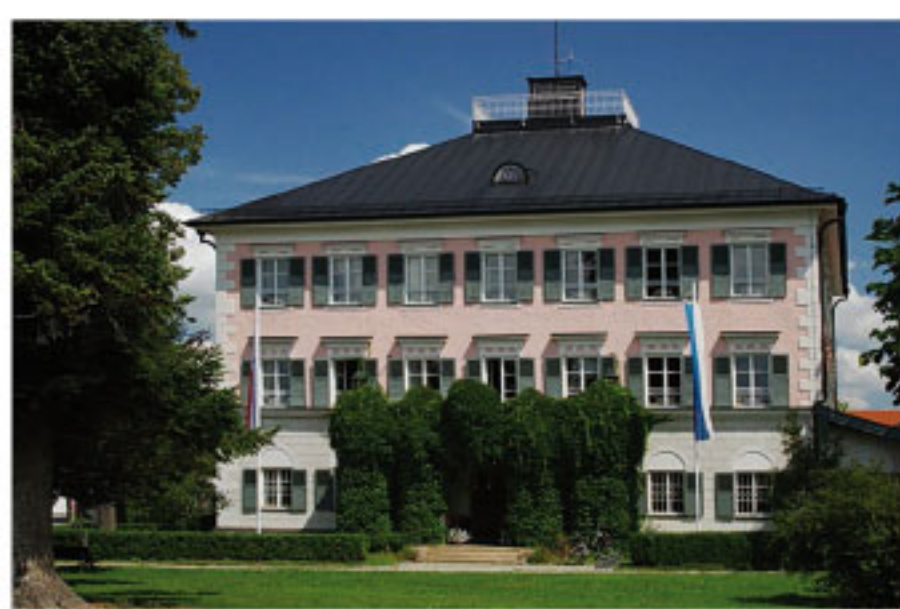
Rathaus im Schloss Grabenstätt

Einzelne Abschnitte am Chiemsee Rund- und Radweg sind als Erholungspromenaden nur für Fußgänger ausgewiesen. Diese ufernahen Abschnitte sind für Radfahrer gesperrt.