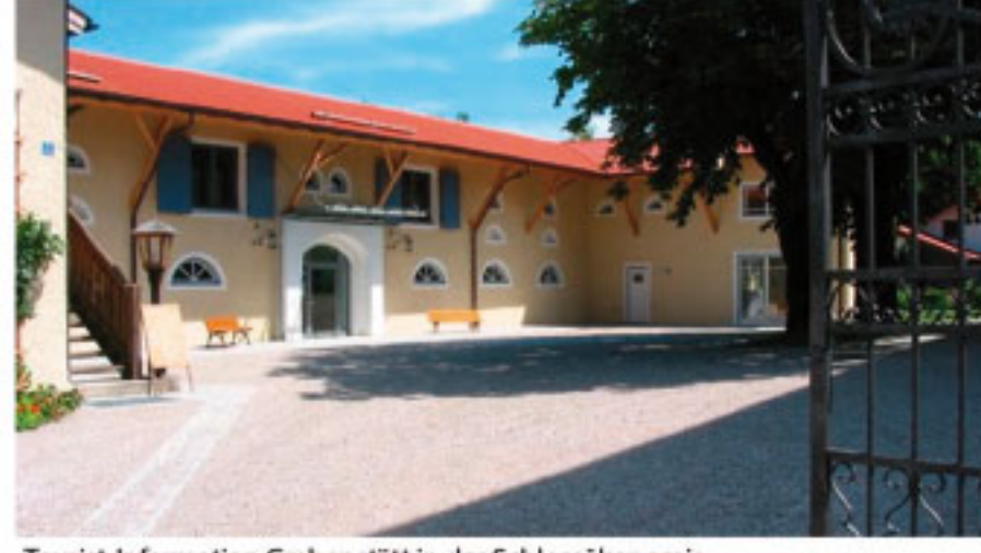
Tourist-Information Grabenstätt in der Schlossökonomie